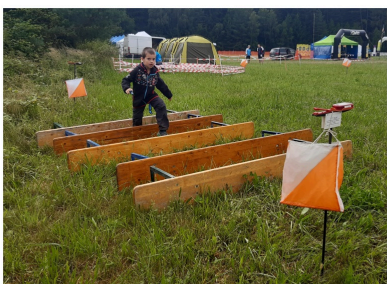
Kros v aréně