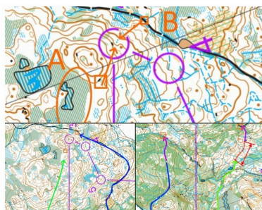
Orienteering Technical trainings