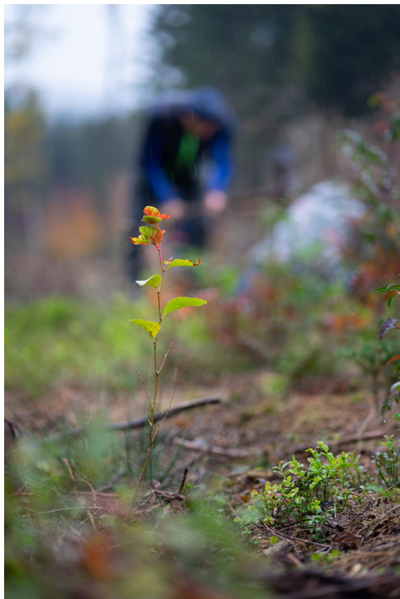
Sázíme si lesy.

Prioritou při pořádání závodů na jakékoliv úrovni je pro orientáky odjakživa šetrnost k přírodě, neboť ta je naším sportovištěm a chceme se do ní vracet. Většina pořadatelského materiálu (startovní čísla, kontroly, pořadatelské zázemí, ...) se po akci sbalí a používá opakovaně i několik let. V arénách dodržujeme třídění odpadů, snažíme se zajistit občerstvení od lokálních firem a podpořit tím regiony, kde běháme.