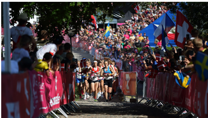
Start při závodech Světového poháru.

Od té doby ušel orienták dlouhou cestu. Dnes se může pochlubit například největším sportovním štafetovým závodem, kterým je finská Jukola, kde běžně startuje přes 3 500 štafet. Za zmínku také stojí obrovské vícedenní závody O-Ringen ve Švédsku, kde už několikrát běželo přes 20 000 účastníků.