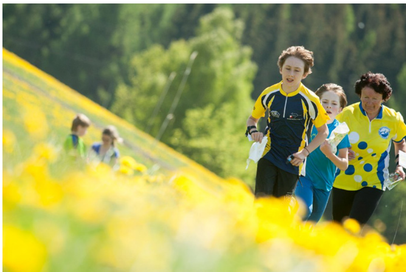
Zábava od žáků až po veterány.

Orienták je sport pro všechny generace, věkovým rozpětím 0-80+ se moc sportů chlubit nemůže. Začínají už malí špuntí, kteří sotva jdou - v kategorii HDR (dítě s doprovodem) můžeš spatřit i miminka v šátku na hrudi hrdého rodiče, které tímto způsobem absolvují svůj první závod. Veteráni (Masters), kterých je v jiných sportovních odvětvích relativně málo, tvoří v orientáku značnou část aktivních závodníků a komunity. Přátelství, které je po léta pojí, poznáš zejména v cíli, kdy i desítky minut diskutují o ideálním postupu mezi kontrolami.