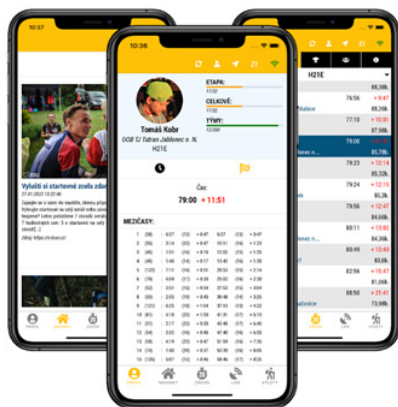
Mobilní aplikace k sérii Czech O-Tour

Orienták se postupně stal moderním sportovním odvětvím, které naplno využívá nejnovější technologie. Ať už bezkontaktní ražení kontrol, možnost podívat se na svůj postup na trati pomocí GPS nebo s její pomocí sledovat živě nejlepší závodníky. Vše je běžnou součástí nejen mezinárodních závodů.