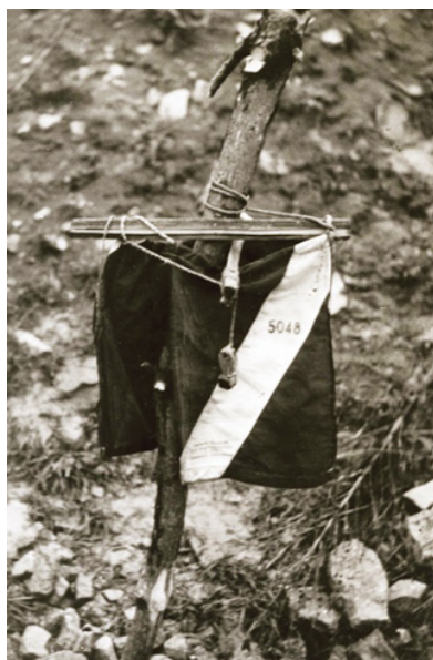
Jeden z prvních stojanů na kontrolu.

Historie našeho sportu sahá do konce 19. století ve Švédsku, kde byla orientace neznámým terénem pomocí mapy a buzoly oblíbenou tréninkovou aktivitou na vojenských akademiích. První závod pro veřejnost se však neuskutečnil tam, nýbrž v sousedním Norsku roku 1893. Na popularitě začal orienták nabývat spolu s rozšířením buzoly v 30. letech 20. století, nejprve pouze v Evropě, po druhé světové válce po celém světě.