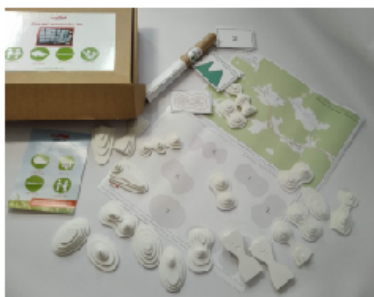
Mapuito - vrstevnice

Dominic Ullrich – Athletics and more – YouTube kanál trenéra a metodika Německého atletického svazu, na kterém najdete série zábavných cvičení a netradičních pomůcek. Atletický trénink na sportovní škole, trénink doma, s kužely, s balančními deskami, s lavičkami, v písku, vánoční skákání, kooperativní hry a spousta dalšího na vás čeká na tomto YouTube kanálu.