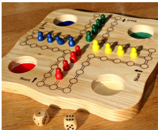
Člověče, nezlob se! (běžecká hra)

Po rozkliknutí obrázků níže se dostanete na připravené mapové úlohy pro trénink Vašich svěřenců.