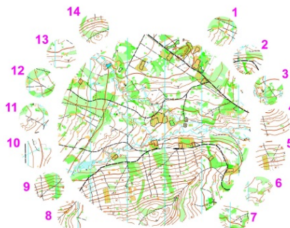
Mapový test Dobříš