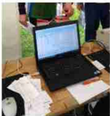
Quick Event (program)