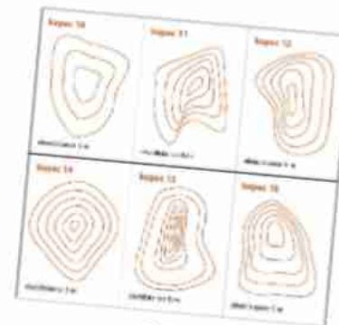
Hra "Porovnávačka" (procvičení vrstevnic)