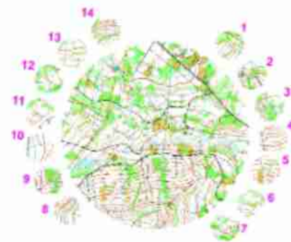
Mapový test Dobříš